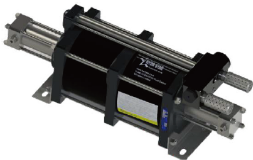
АНР10-2D-520 двойного действия, два поршня привода