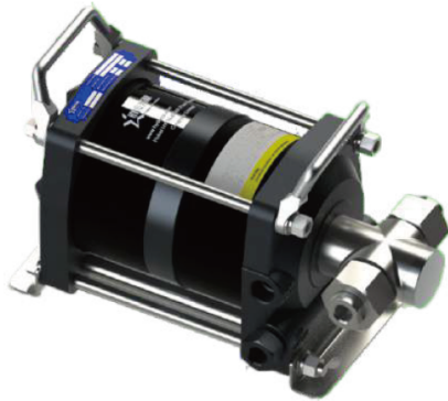
АНР06-2S-20 одинарного действия, один поршень привода