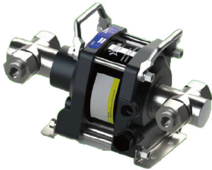
АНР06-1D-60 двойного действия, один поршень привода