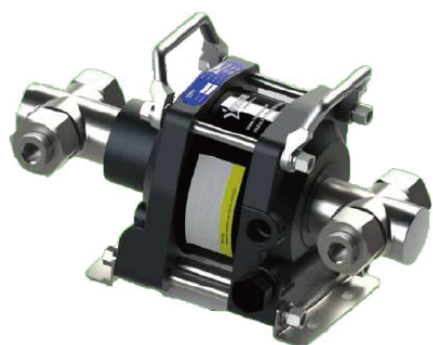
АНР06-1D-25 двойного действия, один поршень привода