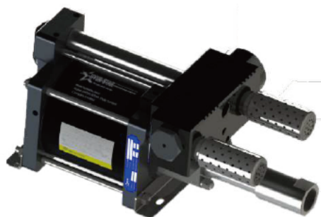
АНР06-1D-12L Длинно-ходовой двойного действия, один поршень привода